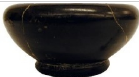
La Albufereta, MARQ ALB-1507