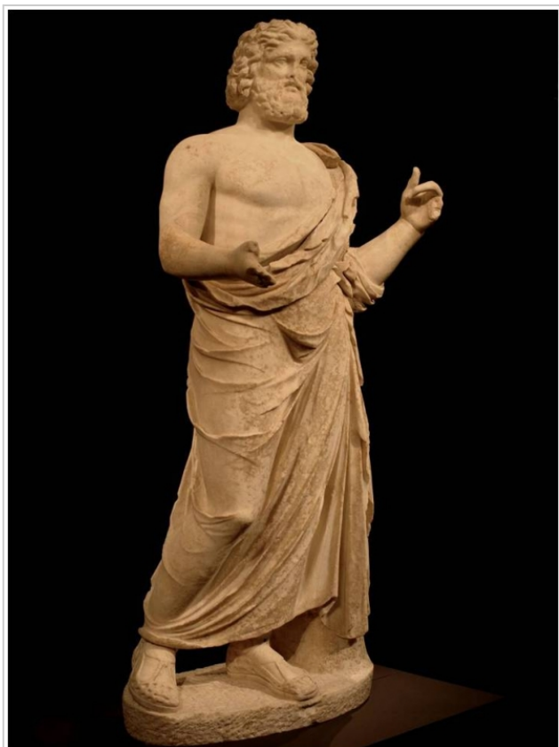
Empúries, MAC-E 2036 MAC-EMPÚRIES