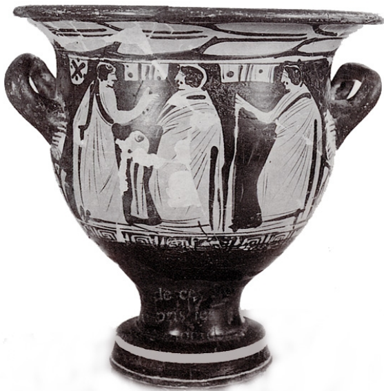
Galera, MAN 1979-70-GAL-T106-3 SÁNCHEZ 1993, p. 30, nº 4B