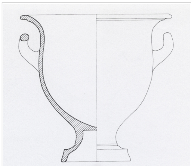
Galera, MAN 1979-70-GAL-T.106-3 SÁNCHEZ 1992b, fig. 36, nº 103