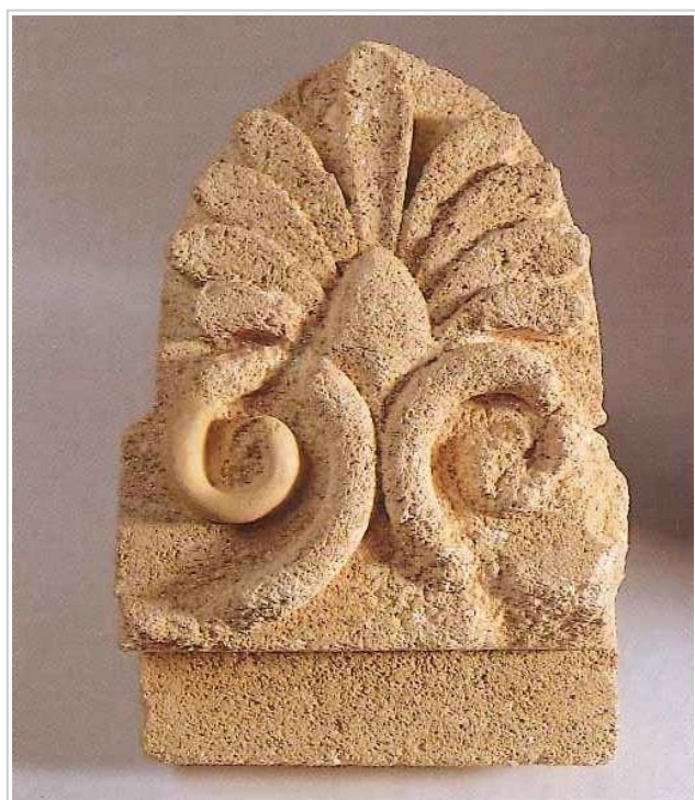
Empúries, MAC-E 2621 MAC-EMPÚRIES