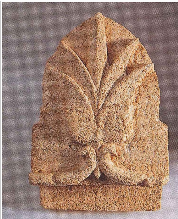
Empúries, MAC-E 2620 MAC-EMPÚRIES