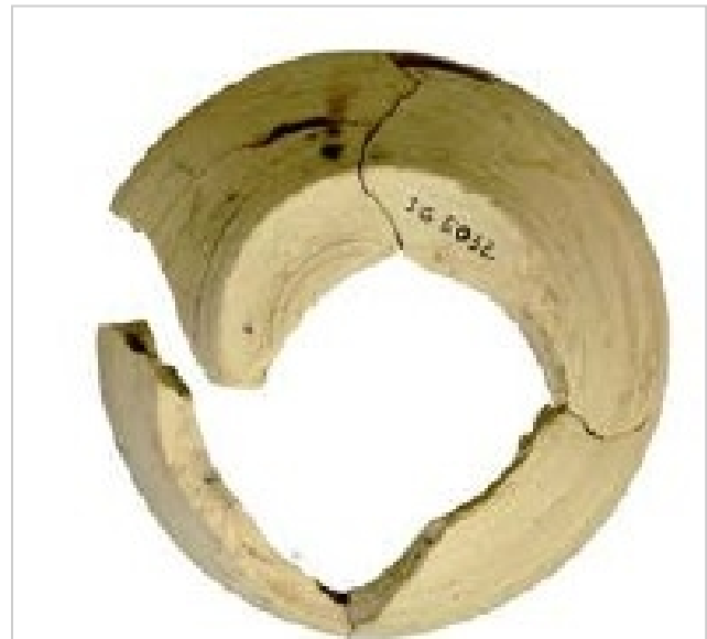
Huelva, calle Puerto 9, MH 5032 GONZÁLEZ DE CANALES/LLOMPART 2017