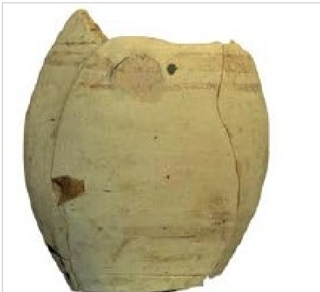
Huelva, calle Puerto 9, MH 5032 GONZÁLEZ DE CANALES/LLOMPART 2017