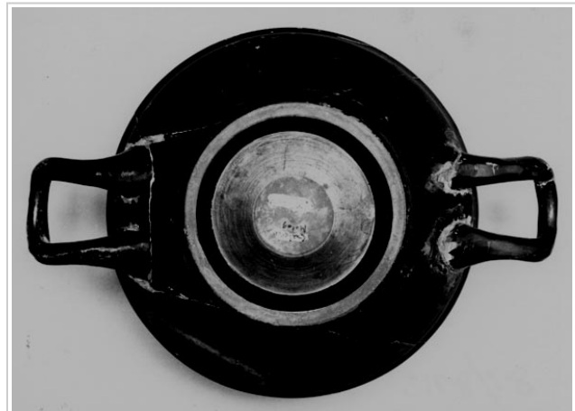
Galera, MAN 1979-70-GAL-T34-7