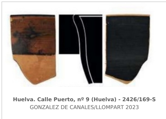
Huelva. Calle Puerto, nº 9 (Huelva) - 2426/169-S GONZALEZ DE CANALES/LLOMPART 2023