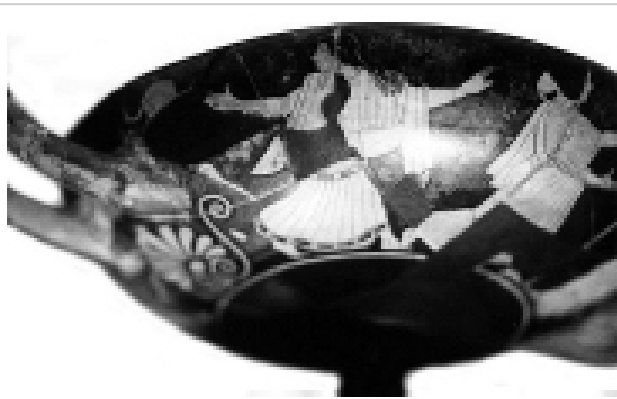
Empúries, MAC-B 582 MIRÓ 2006, nº 63, làm. 14