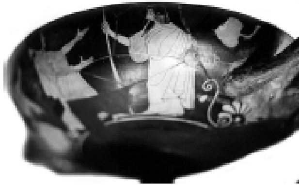
Empúries, MAC-B 582 MIRÓ 2006, nº 63, làm. 14