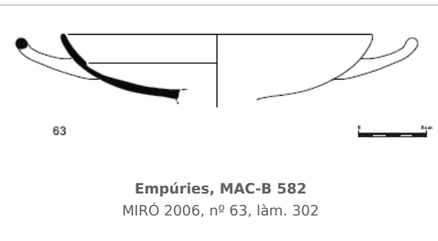
Empúries, MAC-B 582 MIRÓ 2006, nº 63, làm. 302