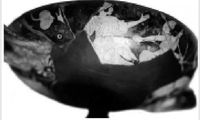
Empúries, MAC-B 582 MIRÓ 2006, nº 63, làm. 14