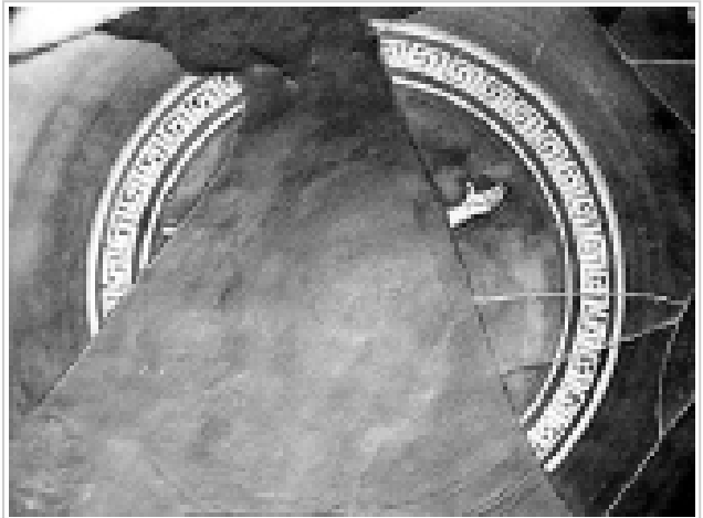
Empúries, MAC-B 582 MIRÓ 2006, nº 63, làm. 13