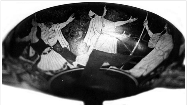
Empúries, MAC-B 582 MIRÓ 2006, nº 63, fig. 416