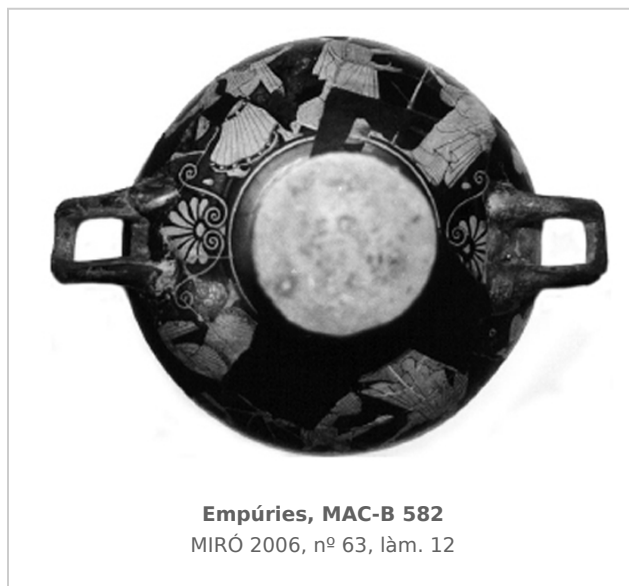
Empúries, MAC-B 582 MIRÓ 2006, nº 63, lám. 12