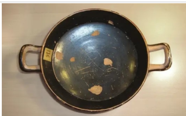
Cerro del Real. Necrópolis de Tutugi, 1979-70-GAL-T.11-3 Rodríguez/Sánchez 2017