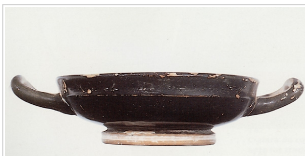
Galera, MAN 1979-70-GAL-T.11-3 SÁNCHEZ 2000b, p. 351, nº 140