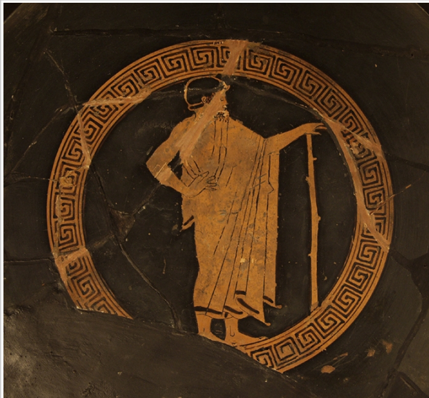
Empúries, MAC-B 585