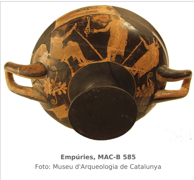
Empúries, MAC-B 585