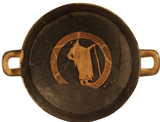
Empúries, MAC-B 585