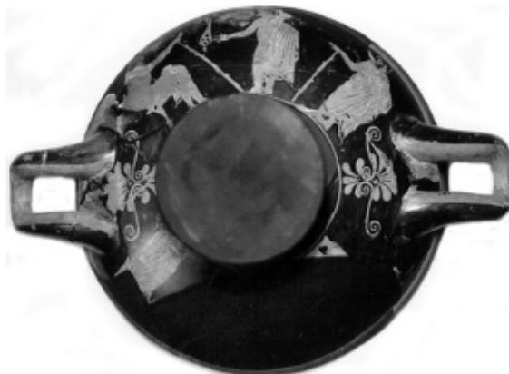
Empúries, MAC-B 585