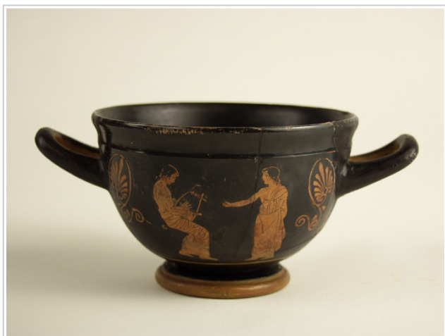
Empúries, MAC-B 578