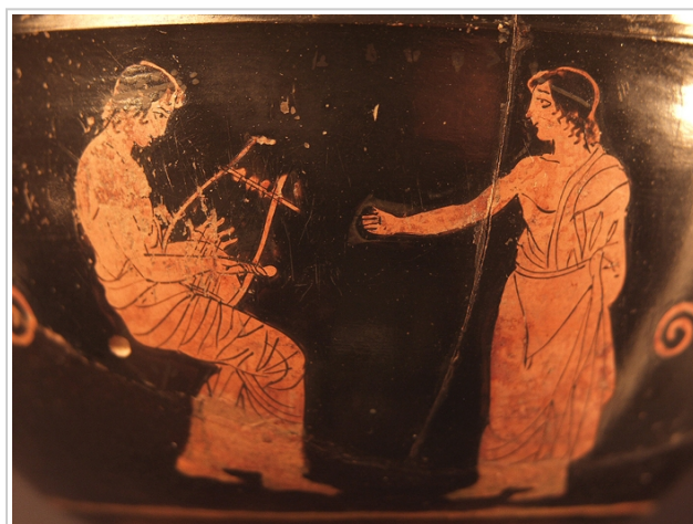
Empúries, MAC-B 578