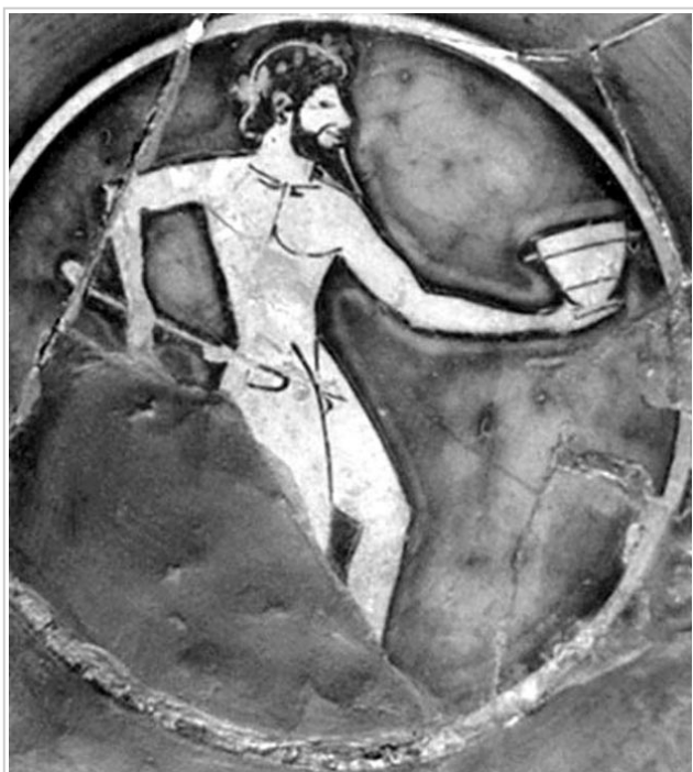
Empúries, MAC-B 612 MIRÓ 2006, nº 1, fig. 354