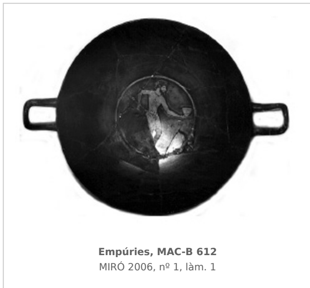
Empúries, MAC-B 612 MIRÓ 2006, nº 1, lám. 1