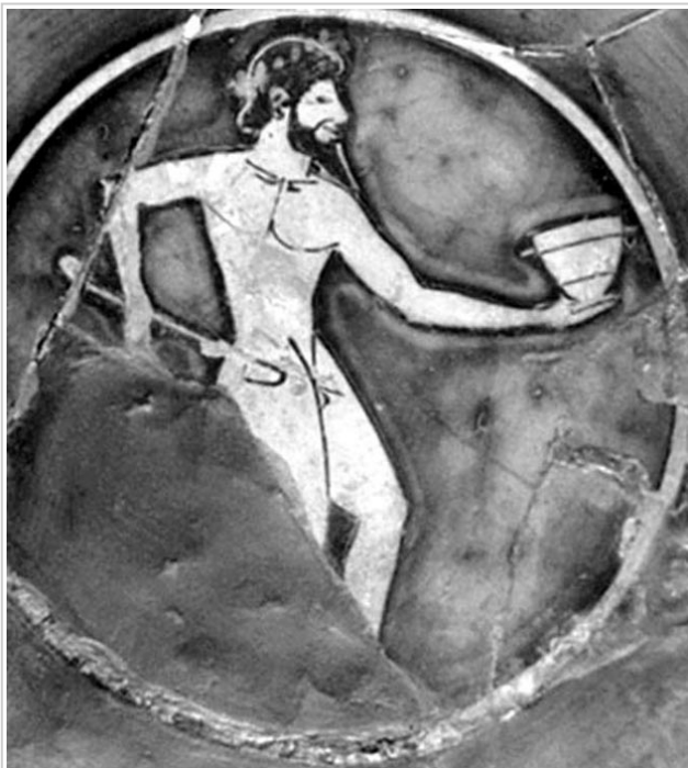
Empúries, MAC-B 612 MIRÓ 2006, nº 1, fig. 354