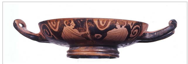
Baza, MAN 1969-68-30