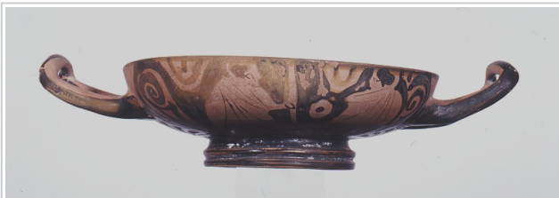
Baza, MAN 1969-68-30