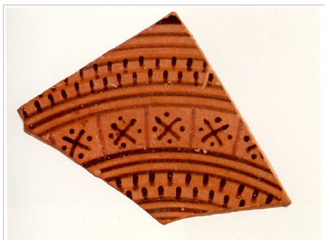
Calle Puerto 9, MUSEO DE HUELVA 5014 CABRERA, SÁNCHEZ (Ed.) 2000b, p. 246, nº 20