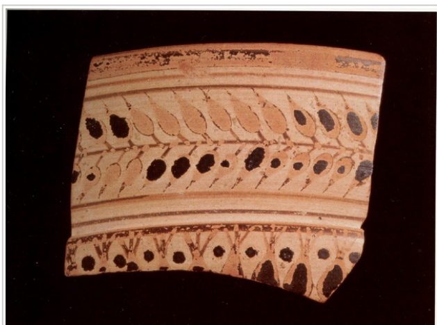
Calle Puerto 9, MUSEO DE HUELVA 5007 CABRERA, SÁNCHEZ (Ed.) 2000b, p. 249, nº 23