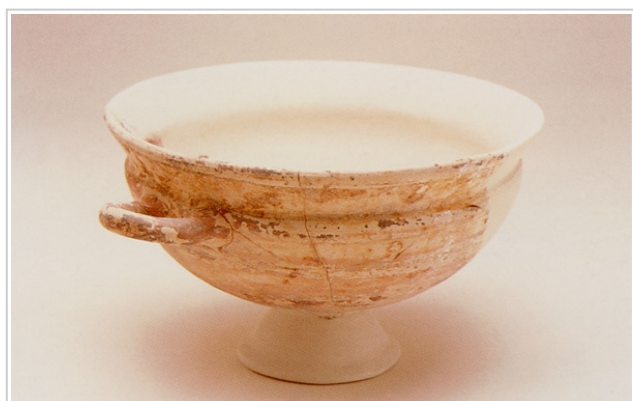
Calle Méndez Núñez 5, MUSEO DE HUELVA 6292/6 CABRERA, SÁNCHEZ (Ed.) 2000b, p. 254, nº 28