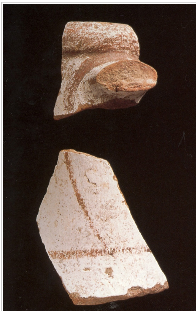
Calle Puerto, MUSEO DE HUELVA 5015 a y b CABRERA, SÁNCHEZ (Ed.) 2000b, p. 259, nº 33