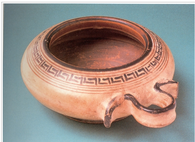
Villaricos, MUSEO DE ALMERÍA 14374 CABRERA, SÁNCHEZ (Ed.) 2000b, p. 263, nº 37