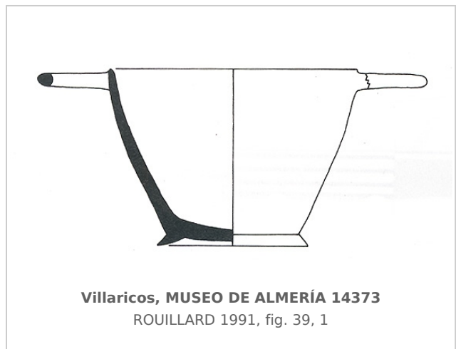
Villaricos, MUSEO DE ALMERÍA 14373 ROUILLARD 1991, fig. 39, 1