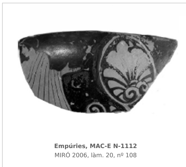
Empúries, MAC-E N-1112