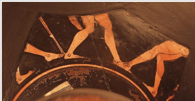
Empúries, MAC-B 588