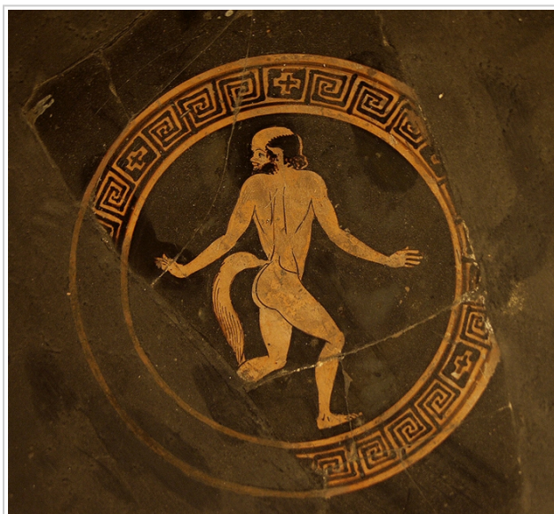
Empúries, MAC-B 588