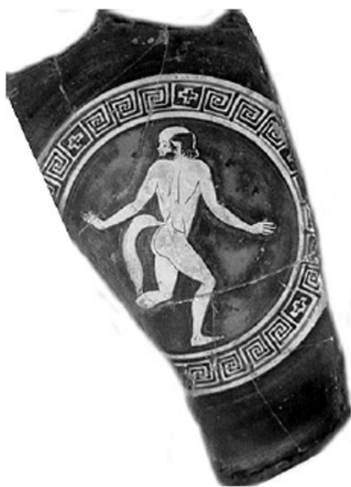
Empúries, MAC-B 588 MIRÓ 2006, nº 142, lám. 25