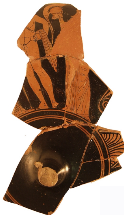
Empúries, MAC-B 505 22201