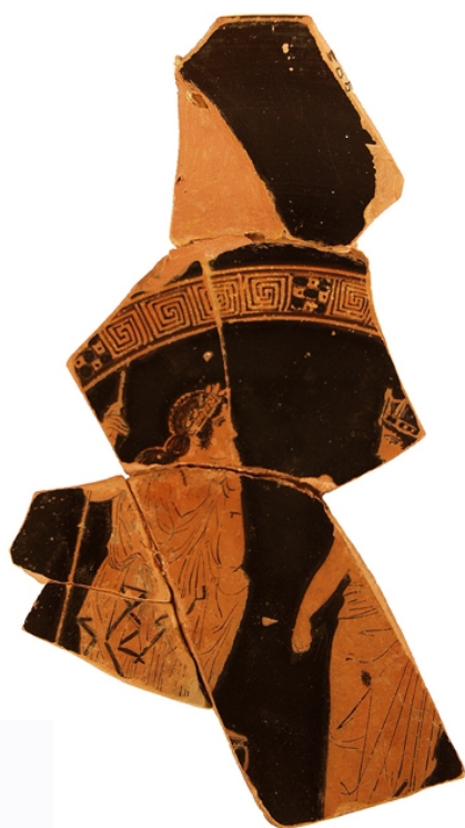
Empúries, MAC-B 505 22201