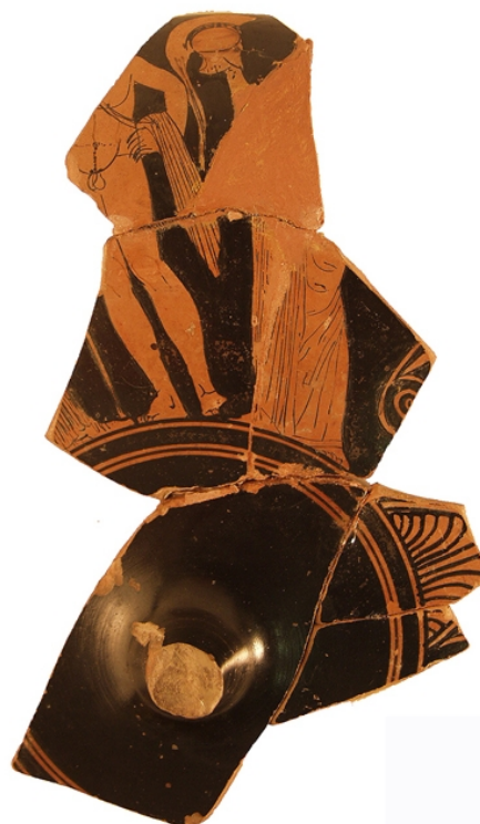
Empúries, MAC-B 505 22201