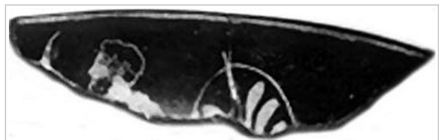
Empúries, MAC-B 583