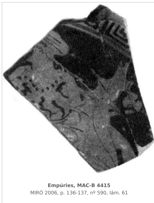
Empúries, MAC-B 4415