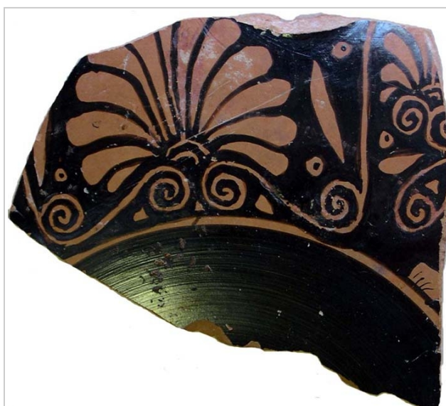
Empúries, MAC-E 98-SM-9725-1