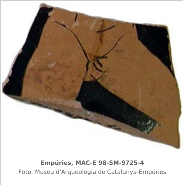
Empúries, MAC-E 98-SM-9725-4