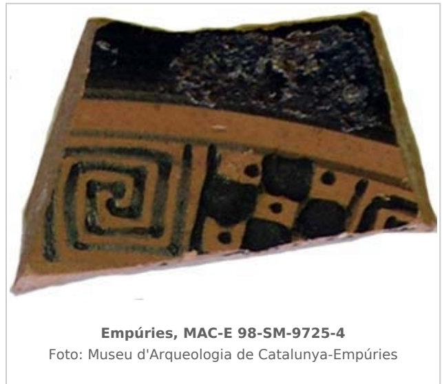
Empúries, MAC-E 98-SM-9725-4