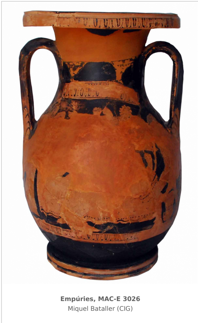
Empúries, MAC-E 3026 Miquel Bataller (CIG)