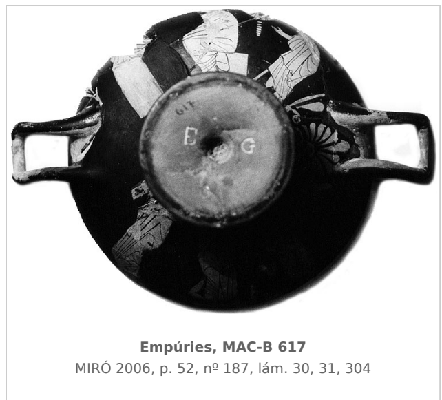
Empúries, MAC-B 617

MIRÓ 2006, p. 52, nº 187, lám. 30, 31, 304