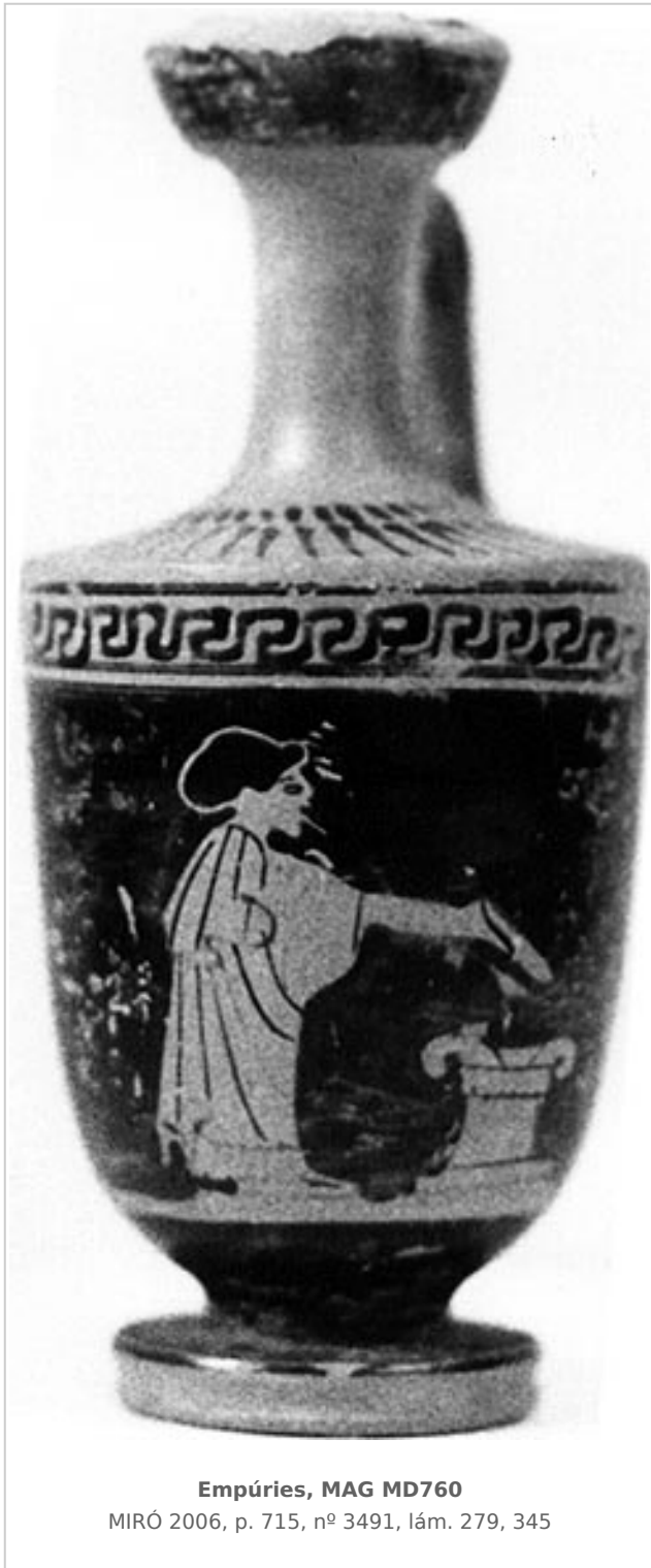
Empúries, MAG MD760

MIRÓ 2006, p. 715, nº 3491, lám. 279, 345