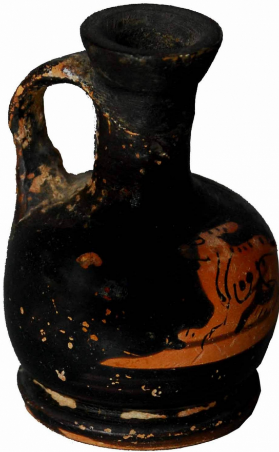
Empúries, MAC-E 1447 Miquel Bataller (CIG)