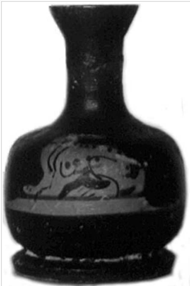
Empúries, MAC-E 1447

MIRÓ 2006, p. 723, nº 3527, lám. 283, 349