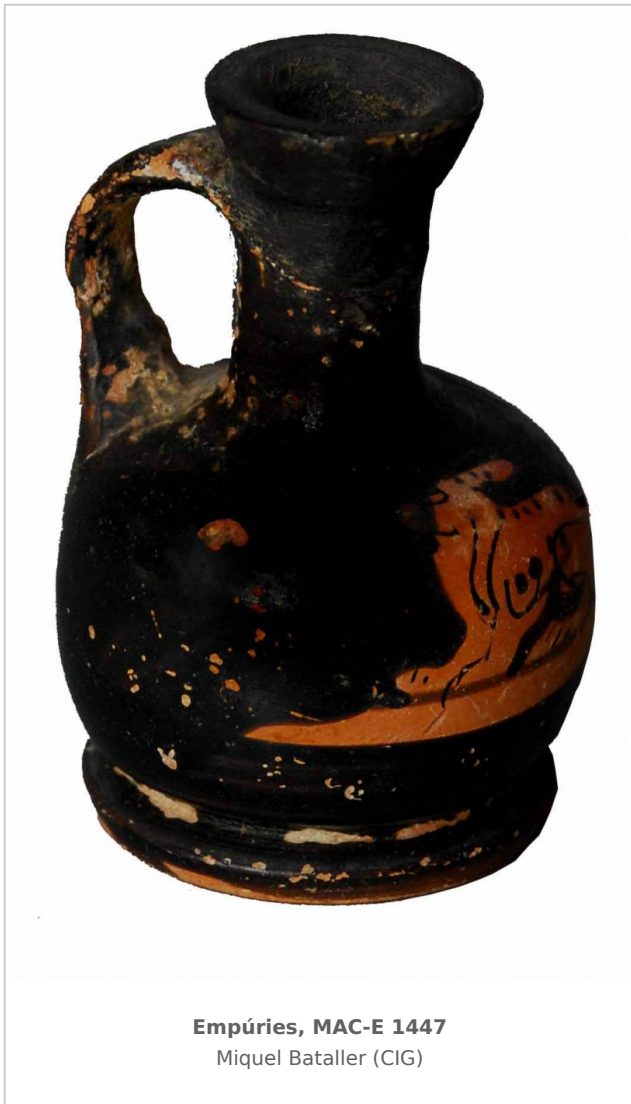
Empúries, MAC-E 1447 Miquel Bataller (CIG)