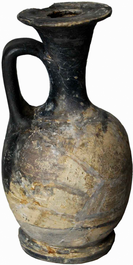
Empúries, MAC-E 1450 Miquel Bataller (CIG)