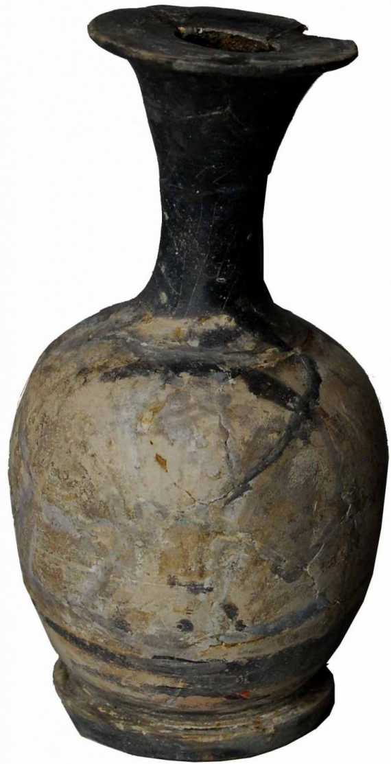
Empúries, MAC-E 1450 Miquel Bataller (CIG)