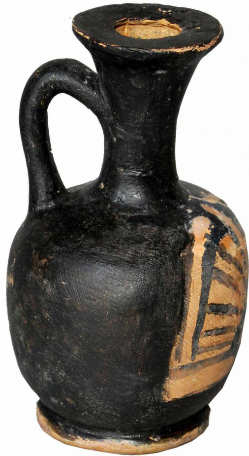
Empúries, MAC-E 1448 Miquel Bataller (CIG)