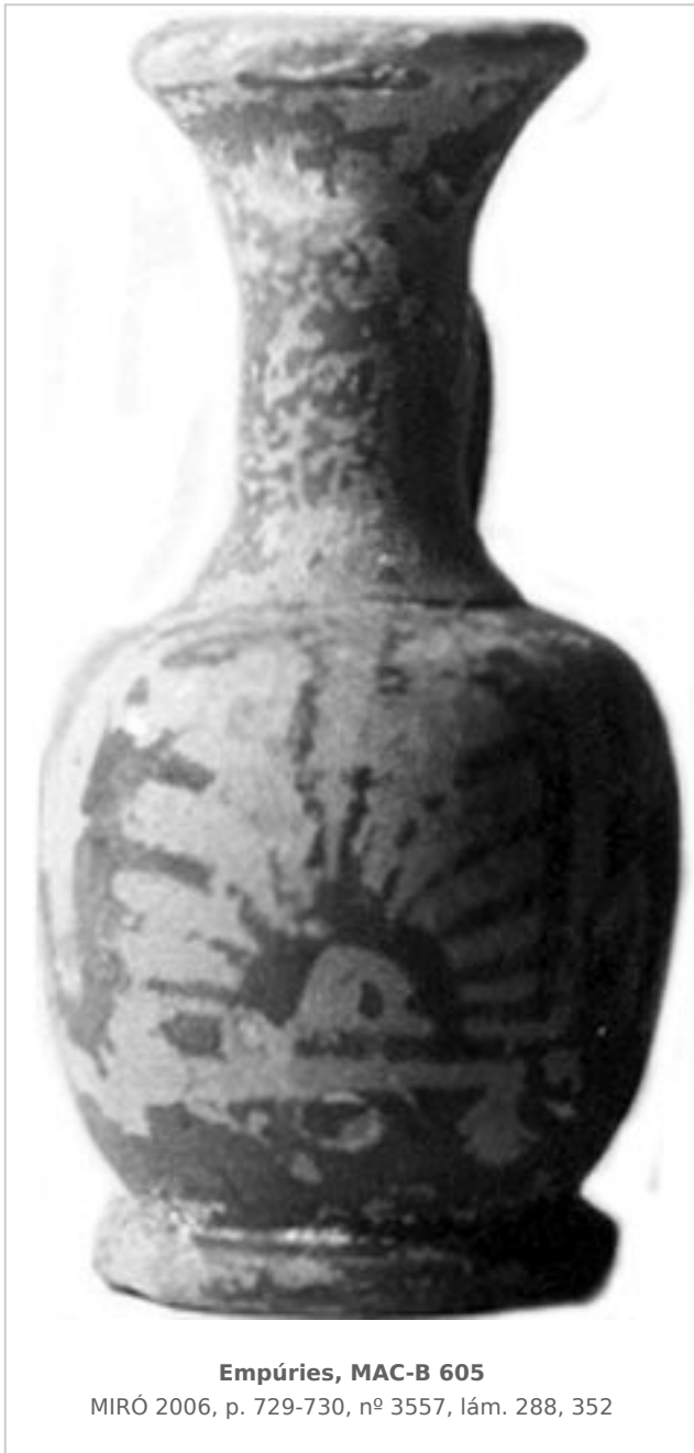
Empúries, MAC-B 605 MIRÓ 2006, p. 729-730, nº 3557, lám. 288, 352