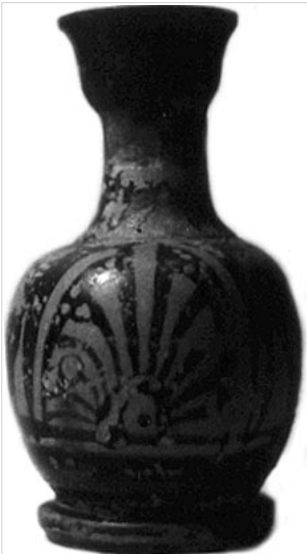
Empúries, MAG MD770