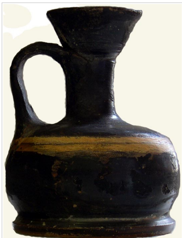
Empúries, MAC-E 462

MIRÓ 2006, p. 745, nº 3632, lám. 296, 357