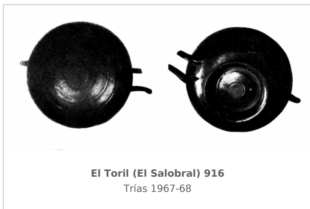
El Toril (El Salobral) 916 Trías 1967-68