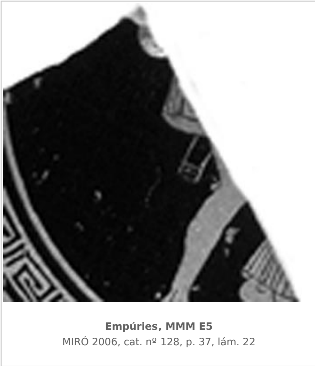
Empúries, MMM E5 MIRÓ 2006, cat. nº 128, p. 37, lám. 22