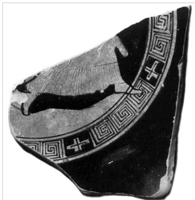
Empúries, MMM E6

MIRÓ 2006, p. 198, p. 205, fig. 494, cat. nº 318, p. 82-83, lám. 44