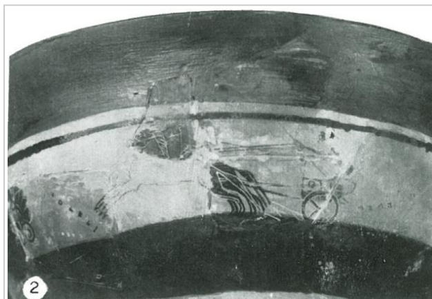
Empúries, MAC-B 423

Trias 1967-1968, p. 92, nº 221, lám. XLVI, 1