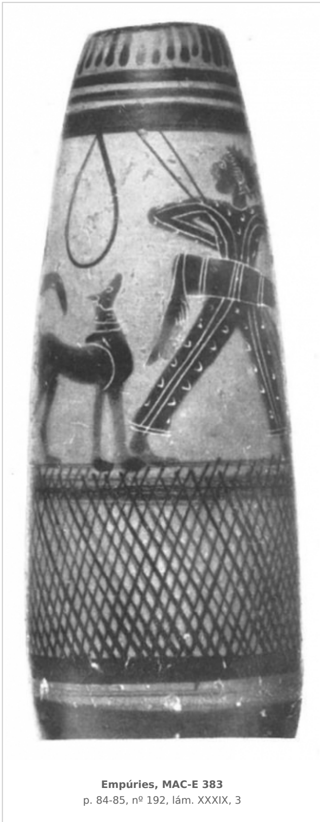
Empúries, MAC-E 383 p. 84-85, nº 192, lám. XXXIX, 3