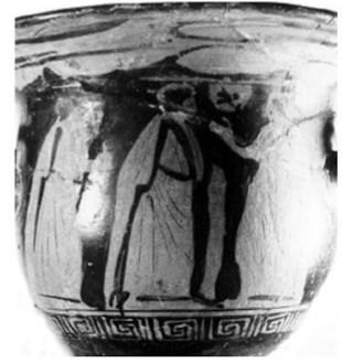
Empúries, MAC-E 1495 MIRÓ 2006, nº 2935, làm. 201