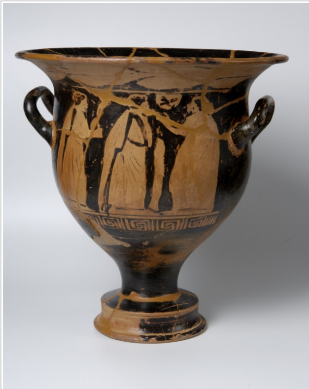
Empúries, MAC-E 1495 Josep Curto (MAC-E)