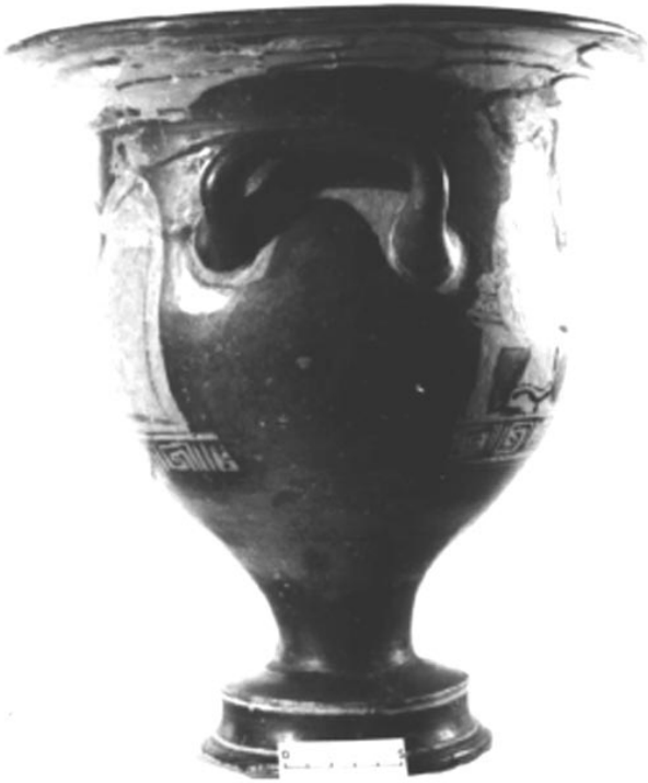
Empúries, MAC-E 1495 MIRÓ 2006, nº 2935, làm. 200