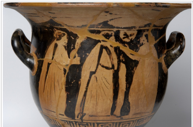
Empúries, MAC-E 1495 Josep Curto (MAC-E)