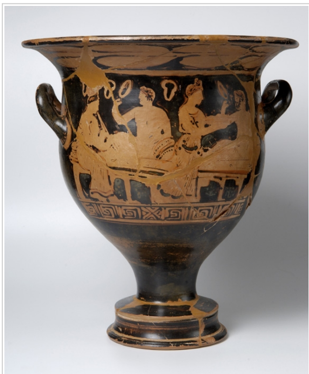
Empúries, MAC-E 1495