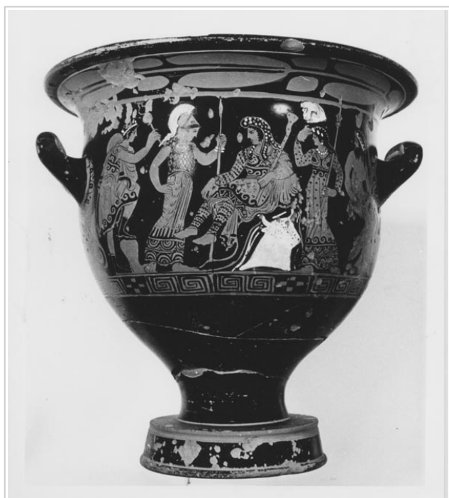
Galera, MAN 1935-4-GAL-T82-1