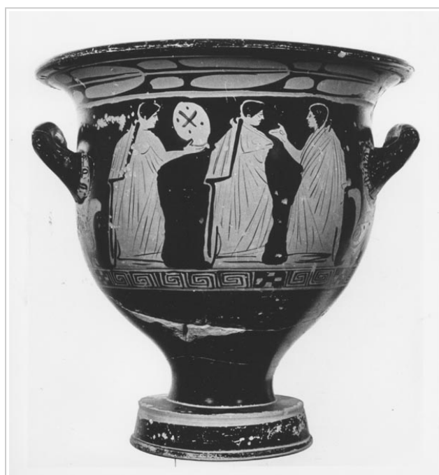
Galera, MAN 1935-4-GAL-T82-1