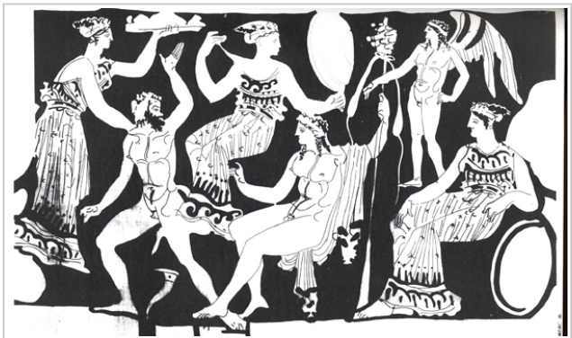
Galera, MAN 1935-4-GAL-T82-2 SÁNCHEZ 1992b, fig. 35, nº 105