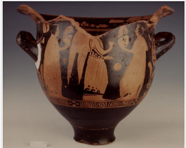
Galera, MAN 1935-4-GAL-T82-2