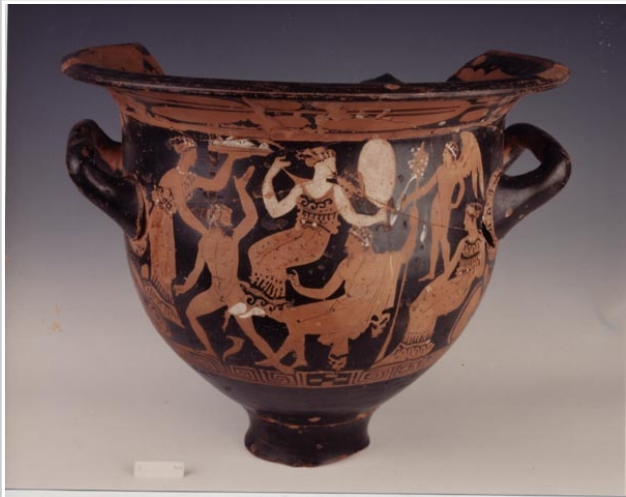
Galera, MAN 1935-4-GAL-T82-2