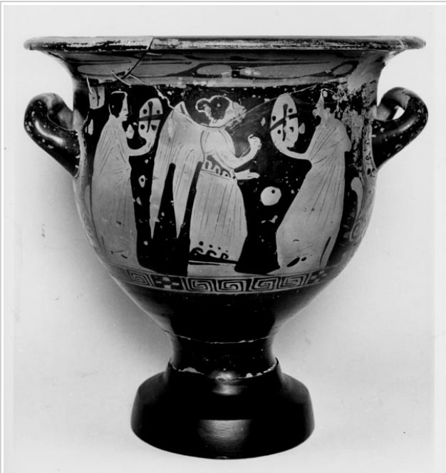
Galera, MAN 1935-4-GAL-T82-2