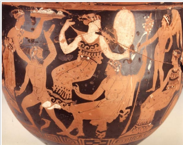
Galera, MAN 1935-4-GAL-T82-2