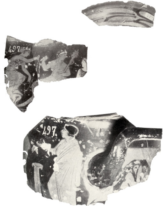
Cerro del Real, Necrópolis de Tútugi, Galera MUSEO ARQUEOLÓGICO Y ETNOLÓGICO DE GRANADA 497