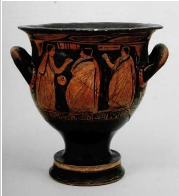
Alcácer do Sal, CFG RG SN 1 ALARÇAO 1996