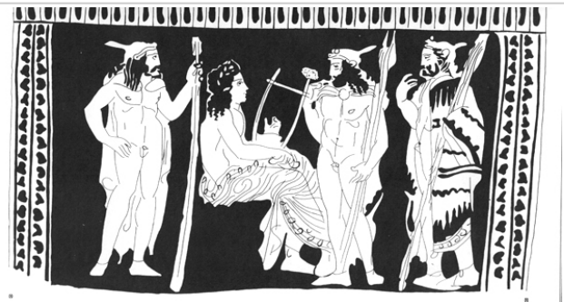
Villaricos, MAN 1935-4-VILL-T39-1 SÁNCHEZ 1991, fig. 2, nº 3