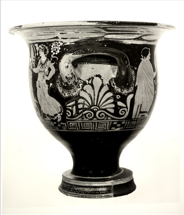
Villaricos, MAN 1935-4-VILL-T52-II-1