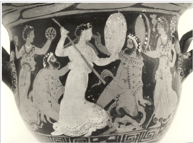
Villaricos, MAN 1935-4-VILL-T52-II-1