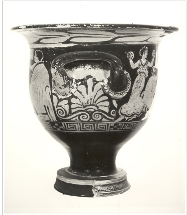
Villaricos, MAN 1935-4-VILL-T52-II-1