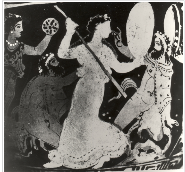
Villaricos, MAN 1935-4-VILL-T52-II-1