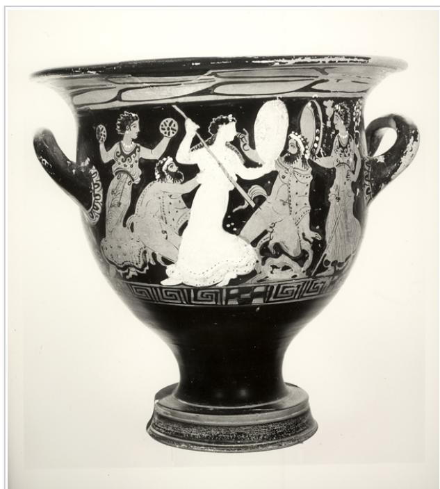
Villaricos, MAN 1935-4-VILL-T52-II-1