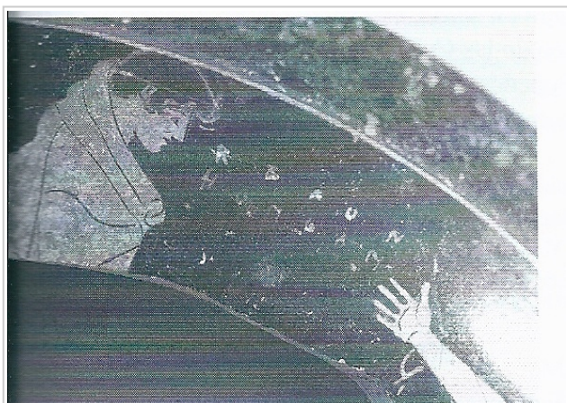
Mas Castellar, MAC-G 41234.1 De Hoz García-Bellido 2014