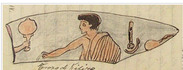
Empúries, MAC-E RG SN 82 a y b Miró 2006