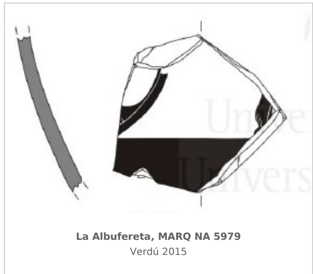
La Albufereta, MARQ NA 5979 Verdú 2015